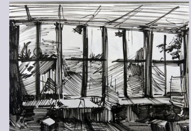
Blick in den Malersaal, Scheersberg

Im breiten Feld von Mode und Design spielt die Siebdrucktechnik eine bedeutende Rolle. Wir wollen mit zeichnerischen und malerischen Methoden Designvorlagen herstellen und dann das Siebdruckverfahren anwenden.