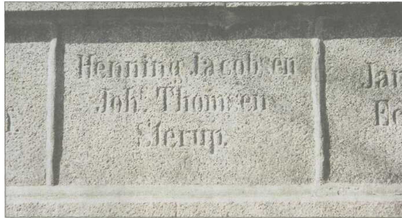
373 Steine mit insgesamt 5156 Buchstaben sind im Bismarckturm verbaut worden.

Die ursprüngliche Spendenliste für die Granitsteine ist nicht überliefert. Doch der Hausmeister des Jugendhofs auf dem Scheersberg, Klaus-Dieter Matzen, hat durch eine aufwendige Vor-Ort-Recherche die Zahl der Steine und die Namen der Spender ermittelt. Jeder Stifter musste für die Anbringung eines Steins im Turmbau 20 Mark berappen. Der einzumeißelnde Spendername wurde zusätzlich mit 40 Pfennig je Buchstabe berech-